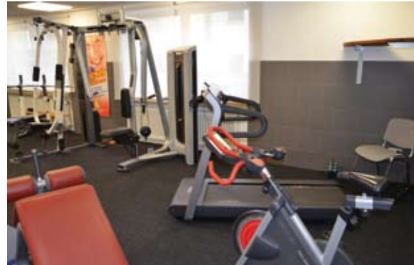
Fitnessraum mit Box-Sack und Geräten für Kraft- und Ausdauersport