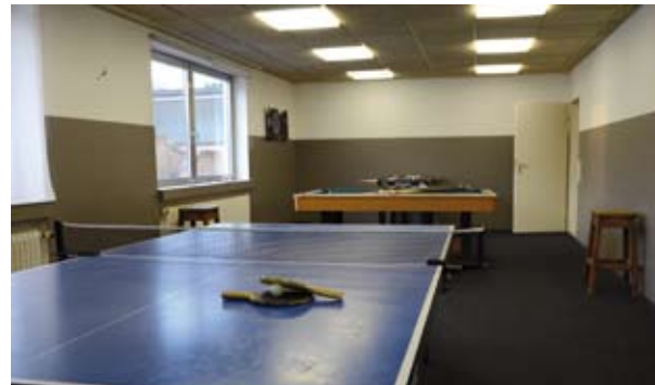
Spieleraum mit Tischtennis, Kicker, elektronischem Dart und Kleinfeldbillard, sowie einer vollautomatischen Kegelbahn und einem 9 Fuss-Billardtisch